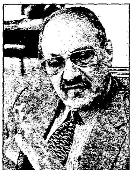
الامير طلال بن عبد العزيز شقيق الملك فهد

بيروت - من ميشيل جورجى: طالب الامير طلال بن عبد العزيز باجراء انتخابات حقيقية في المملكة العربية السعودية والدول العربية، وقال في مقابلة مع وكالة رويترز لاندباء هول من آخر تخلفا من دول اخرى عديدة اجرت انتخابات حرة في بلادها؟ وقال الامير طلال الذي يزور بيروت حاليا للمشاركة في مؤتمر تنظيمه المجلس السعودي للتعليم مع مسؤولين من دول عربية اخرى، ان السعودية ليست مستعدة للانتخابات الحقيقية حتى تصل الى مرحلة تجرى فيها الانتخابات حرة وحقيقية. وكان الامير الذي يعتبر الاكثر ليبرالية بين اشقائه يشرح الى مجلس الشورى السعودي الذي يحضره اعضاء التسعين التمسعين من السعوديين من الاديان والاصناف والاكاديميين والعسكريين والمثقفين، وناقش قضايا يعرضها عليه الملك. وتحدث الامير طلال الذي هو والد الوليد بن طلال الابن الثاني للسعودية، الذي تقدر ثروته بحوالي 13 مليار دولار، عن الحاجة الى الديمقراطية ترحيبا في دول الخليج العربية، وقال بعض دول الخليج انتخابات، ولكنها انتخابات شكلية، وعادة من يدور موجه للعالم الخارجي. هل تريد هذا النوع من الانتخابات؟ ولفت الامير طلال الى ان الانتخابات في دول الخليج العربية، هي في الواقع انتخابات شكلية، وعادة من يدور موجه للعالم الخارجي، وهي في الواقع انتخابات شكلية، وعادة من يدور موجه للعالم الخارجي.